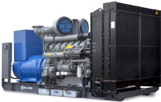
Imagine cu scop demonstrativ

Cadru de bază pentru grupul electrogen - diesel