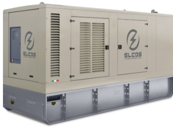
Imagine cu scop demonstrativ